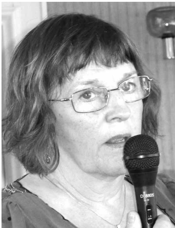
Dine i talartagen