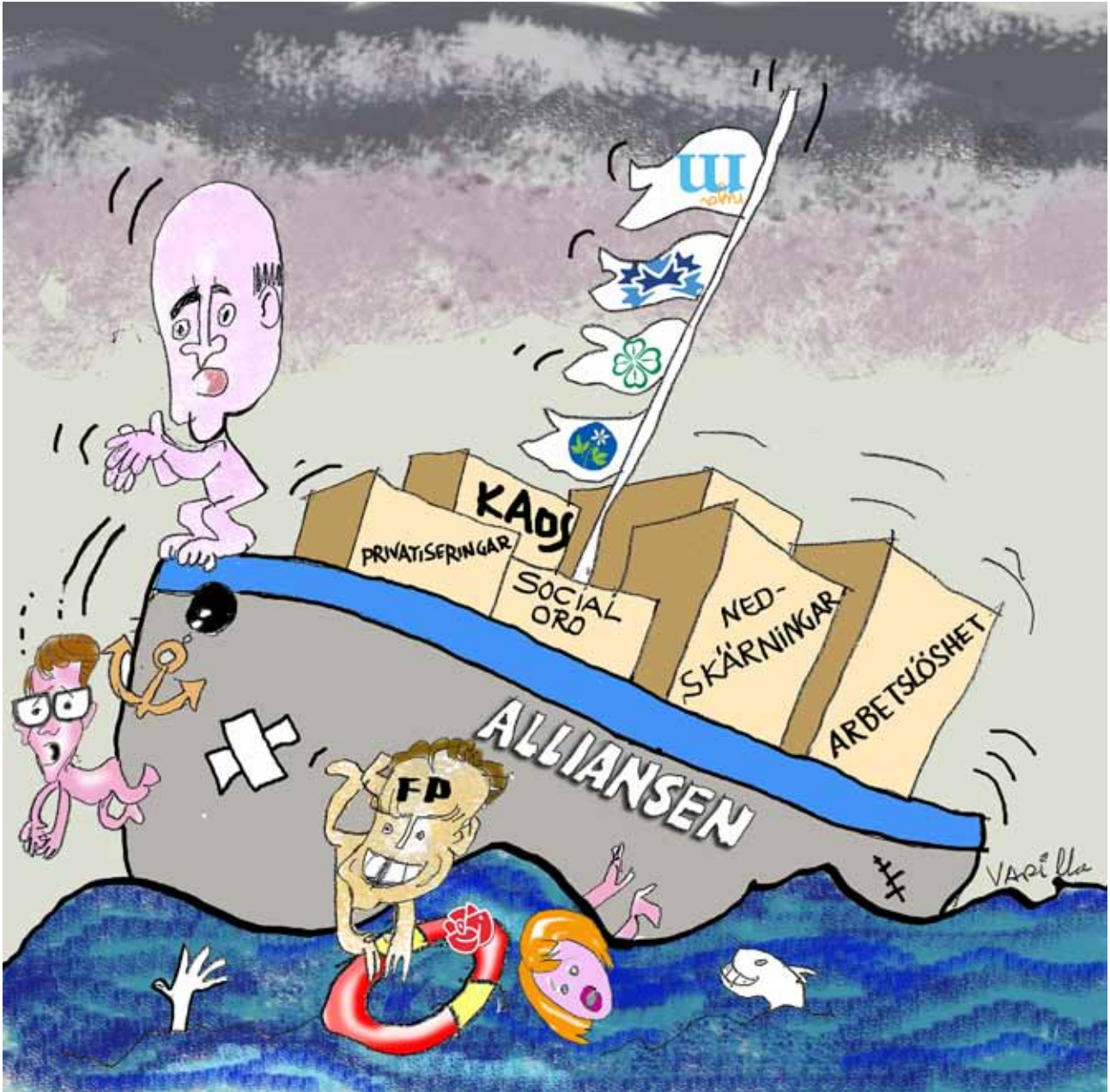
Bild: Jorge Varas «Varilla» Varilla grafisk design och illustration www.varilla.se

NUMMER 6 ÅRGÅNG 24 AUGUSTI 2014 ORGAN FÖR SVERIGES KOMMUNISTISKA PARTI