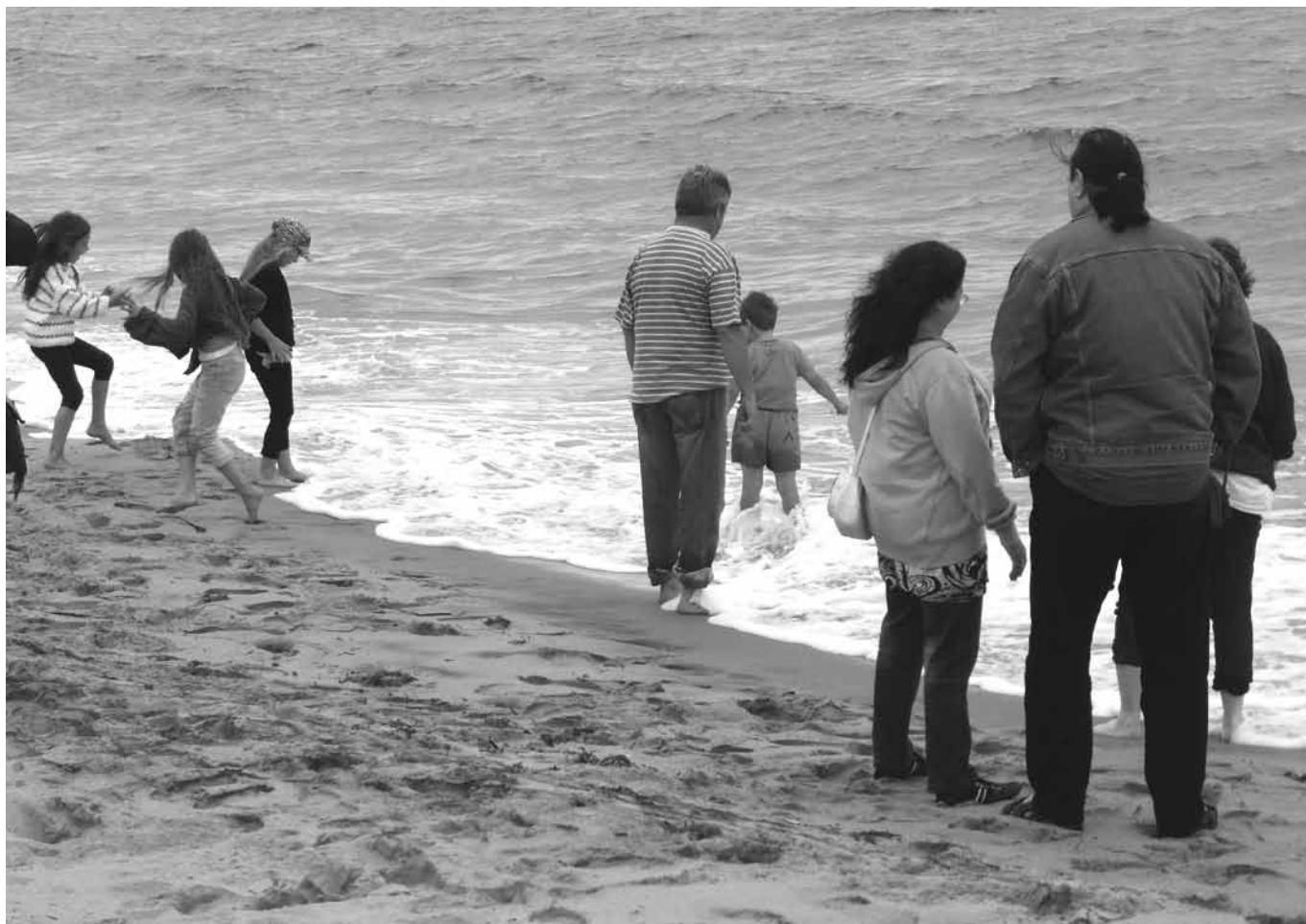
Bad, kultur och politik på kommunisternas sommarläger

De kommunistiska partierna i Norden arrangerar årligen ett veckolångt ideologiskt sommarläger och detta år var inget undantag. Årets läger hölls i Norge på Lista Flypark i Kristiansand, en före detta flygbas som byggdes under den nazistiska ockupationen och som efter kriget brukades av det norska flygvapnet för att sedermera övergå till att bli ett rekreationscenter.